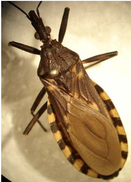
Vinchuca ( Triatoma infestans )

La vinchuca o chinche es un insecto hematófago, es decir que se alimenta exclusivamente de la sangre de personas y animales. Esta chinche se reproduce mediante huevos. La cría que nace de esos huevos es conocida con el nombre de ninfa o chinche pila y también se alimenta de sangre. Las ninfas (estados inmaduros) cambian el pelecho (mudan) cinco veces antes de convertirse en vinchucas adultas. Las crías no tienen alas y las adultas sí.